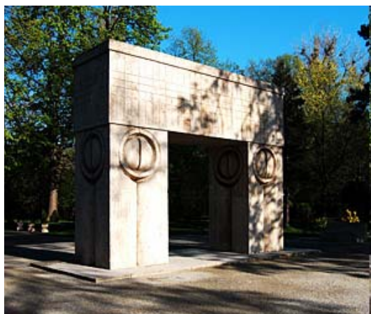
Poarta Sarutului – Constantin Brancusi.

Urmeaza apoi Aleea Scaunelor reprezentandu-i pe cei care participa fara sa se implice, asteptand finalul.