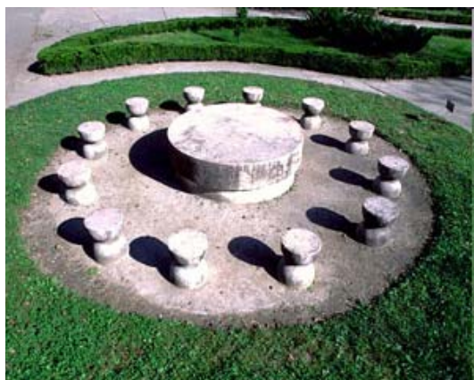
Masa Tacerii – Constantin Brancusi.

Masa Tacerii este realizata din calcar, avand urmatoarele dimensiuni: diametrul tablei – 2,15 metri cu o grosime de 0,43 m, iar piciorul are un diametru de 2 metri si o grosime de 0,45 m. Potrivit exegetilor artei brancusiene, Masa Tacerii reprezinta masa la care stau soldatii inaintea confruntarii cu inamicul. In acelasi timp, scaunele reprezinta timpul dispus in clepsidre. Unii fac o analogie cu Cina cea de Taina a lui Leonardo da Vinci.